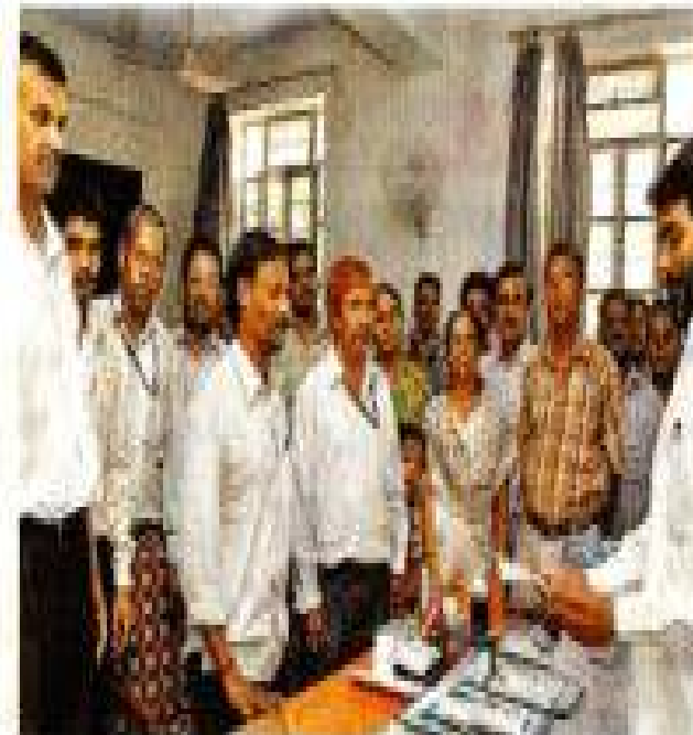
जयपुर: राजस्थान मानवविकास आयोग की ओर से जारी दैनिक संकल्प लेते हुए।

जहाँ एक के धीरे-धीरे सड़ना दिना से शुरू होना। सर्वोच्चता नहीं की संज्ञा बनाना। विविध धर्मों का, समाज का, तुलना की अभाव का विचार होना। अपना ही नहीं लेना ही सम्मान और उसके अनुभव की अभाव का विचार होना। संविधान व संवैधानिक अधिकारों के अर्थ में अहंकार की ओर बढ़ने का उदर बनाना।