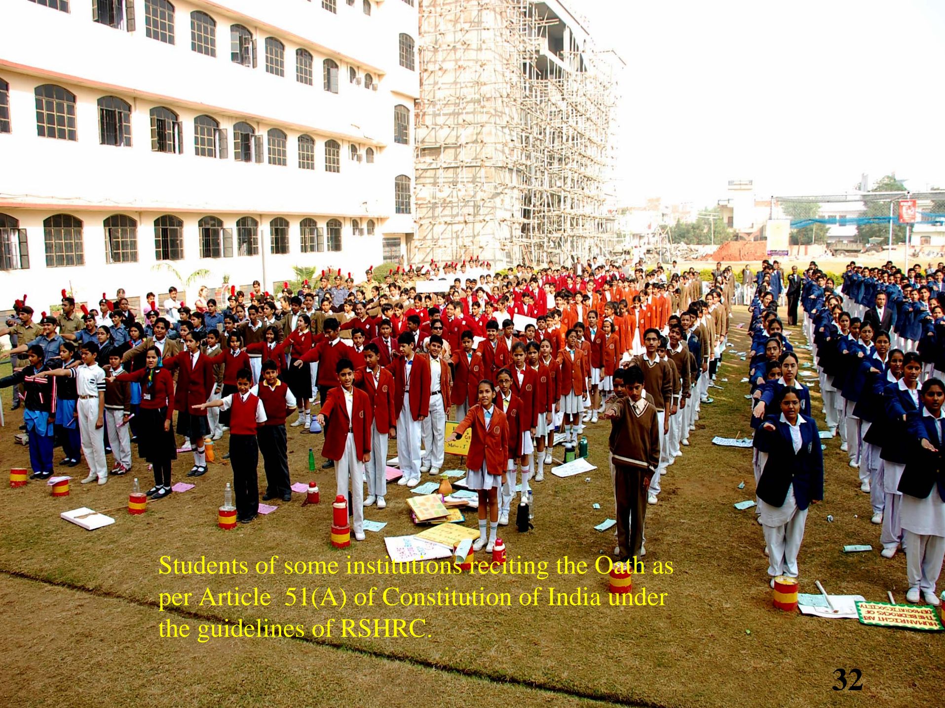
Students of some institutions reciting the Oath as per Article 51(A) of Constitution of India under the guidelines of RSHRC.